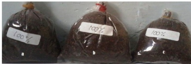
Gambar 2. Hasil uji aktivitas antimikroba ekstrak daun salam dengan konsentrasi 100% terhadap Trichoderma viride pada media baglog jamur tiram

Senyawa aktif fenol yang terdapat pada daun salam dapat mendenaturasi ikatan protein membran sel fungi yang menyebabkan terjadinya lisis dan juga dapat menembus membran inti sel yang menyebabkan sel fungi tidak tumbuh dan berkembang normal (Sulistyawati & Mulyati, 2009). Potensi daun salam sebagai antifungi dikarenakan pada daun salam mengandung beberapa senyawa flavonoid dan minyak atsiri (Sudewo, 2010). Tannin merupakan salah satu senyawa flavonoid pada daun salam yang mempunyai efektivitas sebagai antifungi yang mampu membuat protein yang terlarut menjadi membeku dan berubah menjadi senyawa protein yang tidak terlarut.