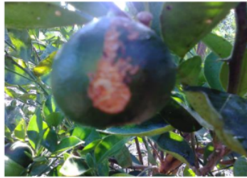
Gambar 1. Buah jeruk muda yang menunjukkan gejala burik

mekar. Serangan oleh hama pada buah jeruk menunjukkan gejala awal berupa warna buah keperakan hingga kecoklatan, tergantung dari jenis jeruknya. Buah yang mengalami gejala demikian disebut dengan “buah burik” (Gambar 1.). Bekas serangan hama pada jeruk akan meninggalkan luka pada buah di sekitar tangkai dan luka ini tidak dapat sembuh sampai buah membesar, sehingga kulit buah berwarna coklat kasar dan tidak bisa hilang. Gejala lain adalah kulit buah menjadi lebih tebal dan berwarna coklat kekuningan, dan kadang ukuran buah mengecil.