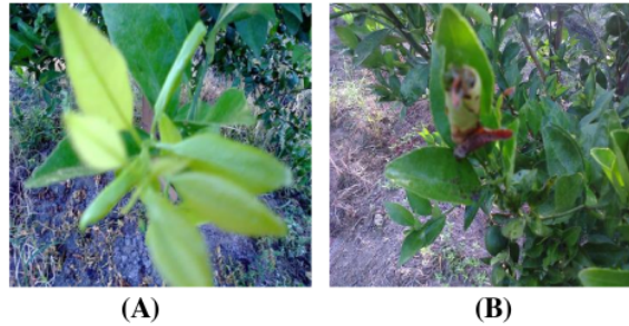
Gambar 4. (A) Daun muda jeruk yang sehat, (B) Daun muda jeruk yang rusak oleh OPT

Walaupun pengaruh konsentrasi biopestisida terhadap persentase kerusakan pada buah dan daun muda hampir sama, tetapi pengaruhnya terhadap tingkat kerusakan daun tua agak berbeda. 11 Hal ini dapat kita lihat pada Tabel 1.berikut ini.