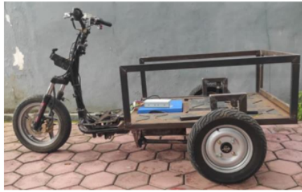
Gambar 3. Rangka Assistive Electric Vehicle

Adapun hasil dari uji coba pertama dan kedua dilihat dari indikator keberhasilan inovasi teknologi asistif dalam pembuatan Assistive Electric Vehicle akses bagi disabilitas fisik adalah sebagai berikut: