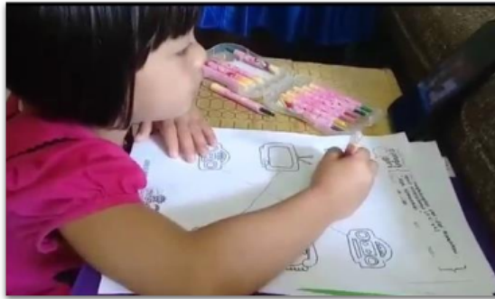
Gambar 5. Peserta didik mengikuti pembelajaran daring dengan menyimak video pembelajaran