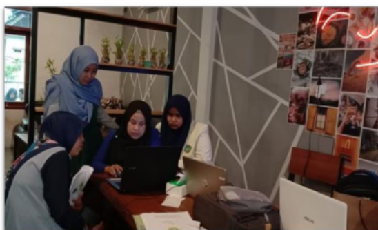
Gambar 8. Tim pelaksana berdiskusi hasil monitoring

Dalam upaya memberikan kesesuaian antara rencana pembelajaran dan pelaksanaan pembelajaran, Tim pelaksana melakukan monitoring kegiatan pembelajaran daring pada KB Sunan Giri. Monitoring dilaksanakan dengan mengecek RPPS, RPPM, RPKH revisi yang telah dibuat sebelum kegiatan pembelajaran dengan pelaksanaan kegiatan. Hasilnya, secara kuantitas, terdapat kesesuaian antara rencana pembelajaran dengan pelaksanaan, meliputi jadwal kegiatan sudah sesuai dengan rencana, materi dan pemberian tugas juga sesuai dengan rencana. Dalam kegiatan ini, tim pelaksana memberikan saran, agar kualitas pembelajaran lebih ditingkatkan, misalnya dengan meningkatkan kualitas dan durasi video pembelajaran, menambah jam untuk diskusi bersama orang tua terkait perkembangan anak usia dini.