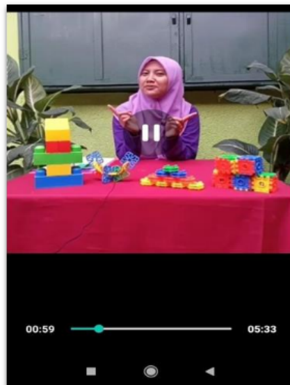
Gambar 3. Video pembelajaran yang telah dibuat oleh tim Guru KB Sunan Giri Kecamatan Balung selama pembelajaran daring dilakukan

Video pembelajaran yang dibuat disesuaikan dengan materi yang akan disampaikan pada anak usia dini. Dalam proses pembuatan video, tim pelaksana dibantu oleh seorang tenaga ahli IT, memberikan beberapa materi dan contoh pembuatan video pembelajaran kepada guru dari KB Sunan Giri Kecamatan Balung Kabupaten Jember. Peraga video pembelajaran adalah guru yang mengajar di KB Sunan Giri Kecamatan Balung. Durasi video pembelajaran tidak terlalu lama, kurang lebih 10- 15 menit agar anak usia dini tidak merasa bosan dengan materi yang diberikan. Materi pembelajaran yang diberikan salah satunya yaitu cara menggunakan alat peraga edukatif dan membuat ketrampilan seperti gambar berikut ini: