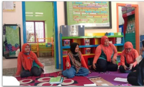
Gambar 11. Guru dan Tim pelaksana saling diskusi untuk mengevaluasi kegiatan pembelajaran daring