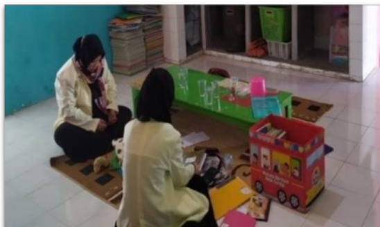
Gambar 4. Menyiapkan alat peraga edukatif untuk kegiatan pembelajaran daring

Tim pelaksana memberikan beberapa contoh alat peraga edukatif yang dapat digunakan selama pembelajaran daring. Alat peraga edukatif dapat diperagakan melalui materi pembelajaran dengan video pembelajaran. Penggunaan alat peraga edukatif dalam setiap kegiatan pembelajaran, disesuaikan dengan tema pembelajaran