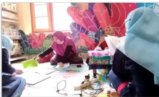
Gambar 2. Tim pelaksana memeriksa, memberi saran masukan terhadap pembuatan RPPM, RPPS, RPKH pembelajaran, untuk direvisi pada pembelajaran daring

Pelaksanaan pembelajaran yang semula dilaksanakan secara luring, pada masa pandemi dilaksanakan secara daring. Sehingga diperlukan beberapa penyesuaian dalam RPPH, RPPM, dan PROSEM. Tim pelaksana memberikan saran terkait revisi perangkat pembelajaran tersebut, diantaranya menyesuaikan kegiatan yang sifatnya kunjungan pada lokasi keramaian ditiadakan; materi pembelajaran diganti dengan video; penilaian capaian perkembangan anak dilaksanakan melalui kerjasama antara orang tua dan anak.