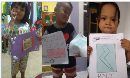
Gambar 6. Kegiatan mengumpulkan tugas melalui foto Aplikasi WhatsApp

Tugas yang telah diberikan melalui WhatsApp grup, setelah selesai dikerjakan, dikumpulkan via japri kepada Guru. Kemudian, diakhir minggu, orang tua ke KB Sunan Giri untuk mengumpulkan bukti fisik tugas.