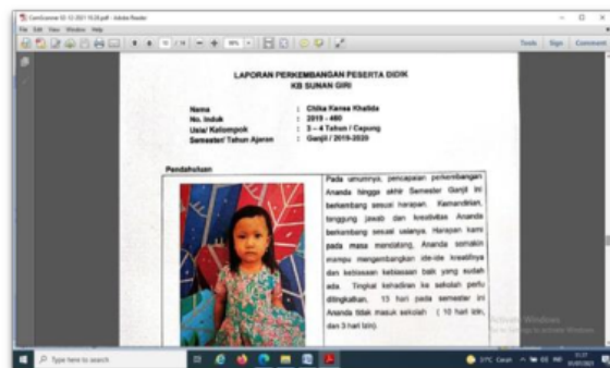
Gambar 9. Laporan penilaian capaian perkembangan anak yang dilakukan bersama orang tua dan guru

Hasil capaian perkembangan anak usia dini diperoleh dari hasil rekapitulasi capaian perkembangan anak yang dinilai bersama antara orang tua dan guru dengan total 30 anak usia dini. Berdasarkan gambar 9. Dapat diperoleh hasil bahwa jumlah anak usia dini yang dapat berkembang sesuai tahapan usia dalam aspek nilai agama dan moral sebesar 66% (20 anak) sedangkan yang belum berkembang sesuai tahapan usia adalah 34% (10 anak). Dalam aspek fisik motorik, anak usia dini yang dapat berkembang sesuai tahapan usia sebanyak 40% (12 anak) dan belum dapat berkembang sesuai tahapan usia adalah sebesar 60% (18 anak). Dalam aspek kognitif, anak usia dini yang dapat berkembang sesuai tahapan usia sebanyak 60% (18 anak) dan belum dapat berkembang sesuai tahapan usia adalah sebesar 40% (12 anak).