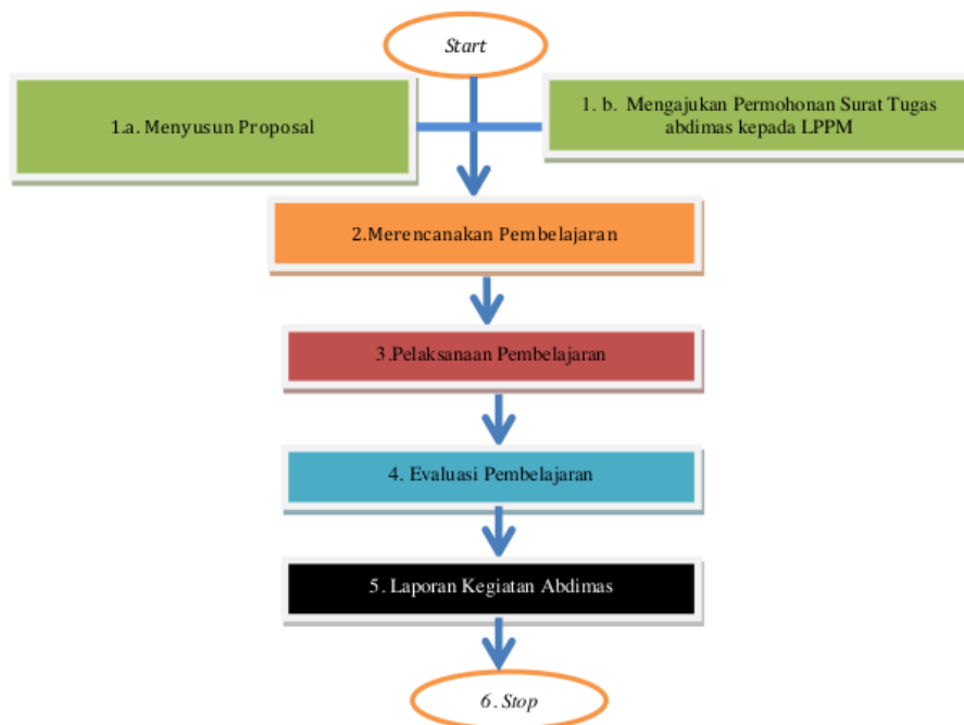
Gambar 1. Pendekatan dan Metode

Kegiatan pengabdian masyarakat ini, melibatkan unsur kepala sekolah (1 orang), guru (5 orang), anak usia dini (30 anak) dan wali murid (30 orang) pada KB Sunan Giri Kecamatan Balung Kabupaten Jember. Kegiatan pengabdian masyarakat yang dilaksanakan berupa pendampingan manajemen pembelajaran daring dilakukan selama kurang lebih 1 semester. Kegiatan pendampingan meliputi konsultasi, praktek pembelajaran daring, merencanakan pembelajaran, pelaksanaan pembelajaran, evaluasi pembelajaran dan diskusi. Permasalahan yang terjadi dalam kegiatan pembelajaran daring pada KB Sunan Giri Kecamatan Balung Kabupaten Jember diupayakan dapat dipecahkan dengan pendekatan dan metode sebagai berikut :