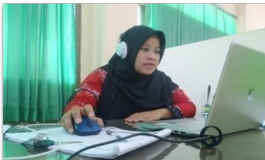
Gambar 7. Tim pelaksana berdiskusi untuk melakukan monitoring kegiatan melalui daring