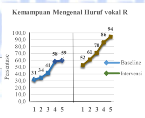
Gambar 1. Persentase Mengenal Huruf