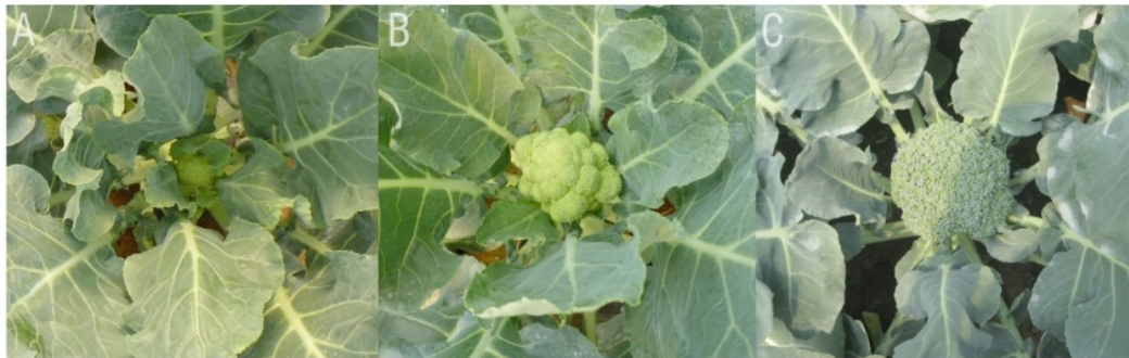
Gambar 1. Perkembangan Krop pada Brokoli (A. Krop 30 hst; B. Krop 60 hst; C. Krop 90 hst)

Fenologi dimulai dari fase Inisiasi Bunga ( F_0 ), Inisiasi bunga merupakan tahap pertama atau stadia 1 dalam fenologi bunga brokoli. Berdasarkan hasil pengamatan pada semua kultivar tahap inisiasi ini terjadi secara seragam yaitu munculnya kuncup kecil pada tangkai daun brokoli yang lebar. Semua kultivar brokoli dalam penelitian (Jamsari et al. , 2007) menunjukkan adanya perkembangan tahap ini dimana menampilkan bakal tangkai yang berwarna hijau dan mulai muncul kuncup bunga. Kuncup bunga pada brokoli membentuk bulatan yang disebut krop brokoli (Gambar 1).