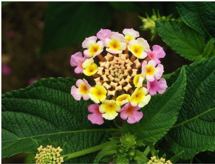
Gambar 1. Daun Tembelean ( Lantana camara )

Secara umum tumbuhan yang mengandung pestisida memiliki ciri-ciri sebagai berikut: memiliki/mengeluarkan bau yang menyengat; tidak mudah rusak akibat hama dan penyakit; digunakan sebagai obat tradisional untuk menyembuhkan penyakit; telah digunakan oleh masyarakat untuk mengendalikan hama dan penyakit (Lasut, 2011). Diantara sekian banyak tanaman yang berpotensi sebagai biopestisida, salah satunya adalah Tembelean ( Lantana camara ).