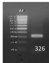
Gambar 1. Hasil PCR gen sY86

Plasmid sY86 yang dihasilkan dari penelitian sebelumnya diamplifikasi dengan PCR kemudian dipurifikasi dan plasmid diisolasi dari gel agarose hasil elektroforesis DNA.