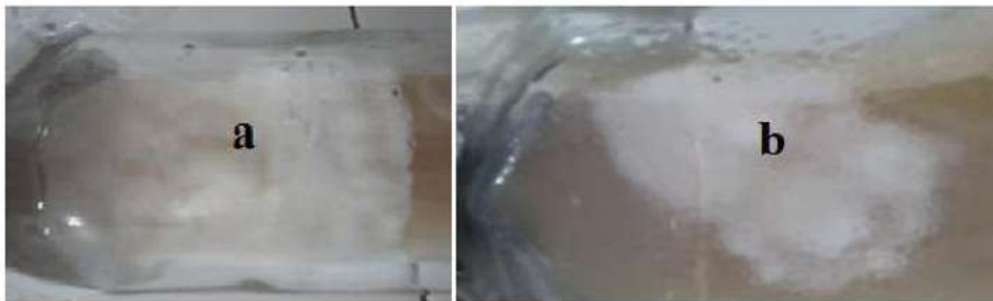
Gambar 1. a) Misellium jamur tiram merah muda b) Miselium jamur tiram putih varietas Grey oyster

Setelah didapatkan misellium dari pembuatan bibit f0 makan sebelum dilakukan persilangan antar kedua jamur tiram, maka dilakukan isolasi miselium monokarion dari masing-masing jamur tiram dilakukan menggunakan mikroskop dengan perbesaran 4x10 ditunjukkan oleh gambar 3 berikut: