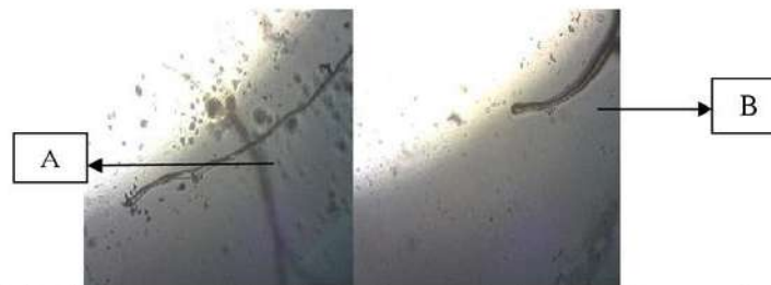
Gambar 2. Isolasi misellium monokarion A) miselium monokarion jamur tiram merah muda B) miselium monokarion jamur tiram putih varietas Grey oyster

Setelah didapatkan misellium dari pembuatan bibit f0 makan sebelum dilakukan persilangan antar kedua jamur tiram, maka dilakukan isolasi miselium monokarion dari masing-masing jamur tiram dilakukan menggunakan mikroskop dengan perbesaran 4x10 ditunjukkan oleh gambar 3 berikut: