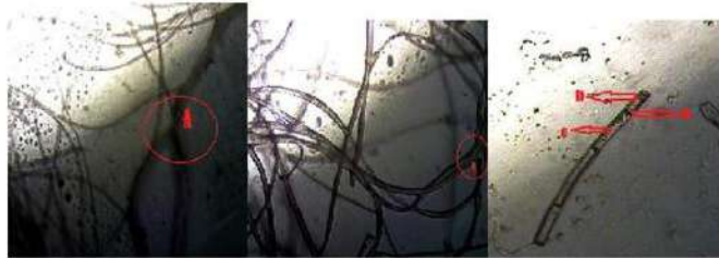
Gambar 4. A) Sambungan apit B) Miselium jamur tiram merah muda ( Pleurotus flabellatus ) C) Miselium jamur tiram putih ( Pleurotus ostreatus ) Varietas Grey oyster .