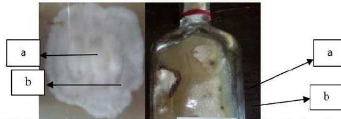
Gambar 3. Bibit F0 hasil persilangan a) miselium jamur tiram merah muda b) miselium jamur tiram putih varietas Grey oyster