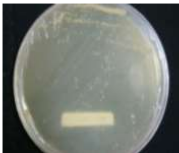
Gambar 2. Hasil Transformasi klon gen sY86 dalam E.coli BL 21 Star pada Medium LB

Gambar di atas menunjukkan bahwa produk blunt-end PCR mempunyai band dengan ukuran yang sesuai target sehingga dapat diligasasikan dengan vektor kloning pET TOPO 200. Hasil transformasi sY86- pET-TOPO ke dalam E.coli BL 21 Star yang ditumbuhkan pada media LB padat yang mengandung antibiotik penyeleksi kanamycin dan menghasilkan koloni seperti dalam gambar 2.