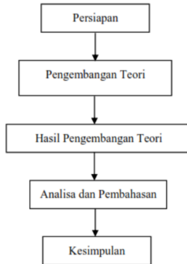
Gambar 1. Bagan Prosedur Penelitian

Penelitian ini merupakan penelitian pengembangan teori yang bersifat kuantitatif. Dengan melakukan studi literatur yang berkaitan dengan teori perturbasi serta mengembangkannya untuk memperhitungkan energi partikel didalam kotak potensial tiga dimensi sehingga menemukan sebuah perhitungan energi partikel dengan menggunakan teori perturbasi. Penelitian ini dilaksanakan pada bulan Februari 2020 sampai dengan Juli 2020. Dengan prosedur penelitian sebagai berikut: